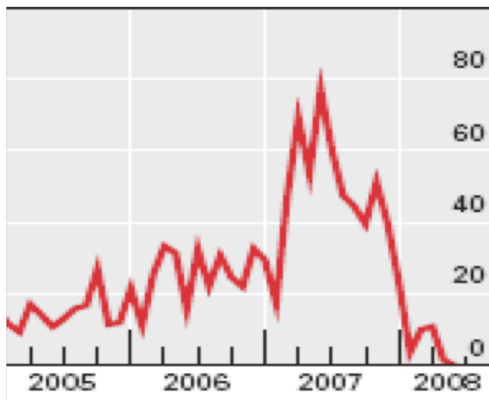
Emisión de préstamos para adquisiciones apalancadas Volúmenes mundiales (miles de millones de dólares de Estados Unidos)

Fuente: BPI (2008). 78o Informe Anual: 112